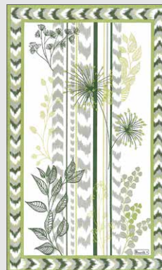
Feuilles d'été original