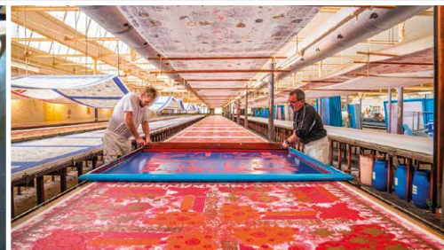
En couverture : Fleurs de pavot rouge