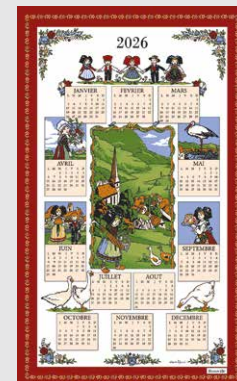
Calendrier Hansi 2026 original