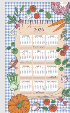
Calendrier Au menu en 2026 original