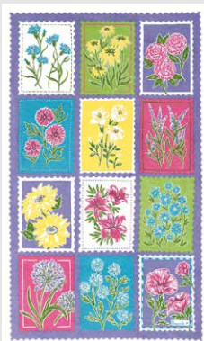
Timbres en fleurs original